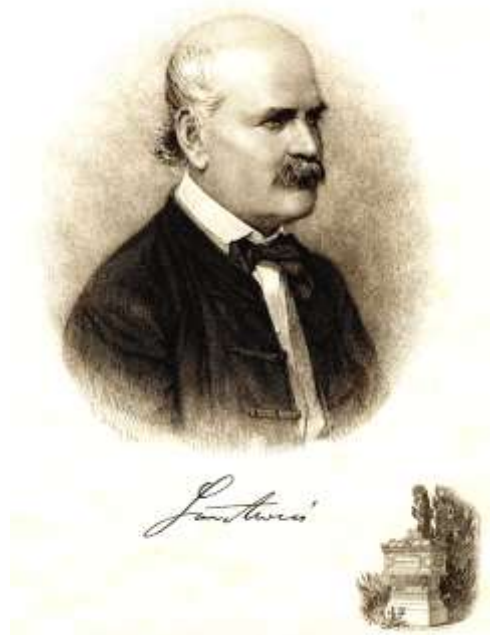
Semmelweis Ignác (1818. július 1. – 1865. augusztus 13.)